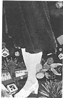
加藤昭次 《フラクタルな微風の中で》 水性木版 86×55cm