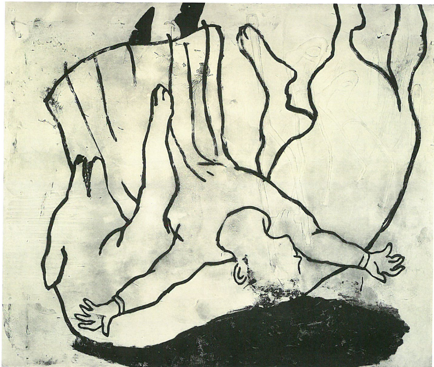
大賞 村上 早《息もできない》銅版 85×98cm