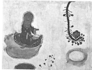
玉分昭光《ナリタチ》 銅版 60×80cm