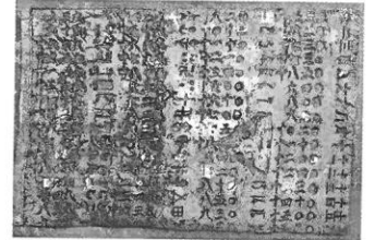
椿一朗喜昭《蓄積の廃景》 木版(一部シルク) 73×104cm