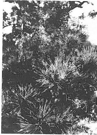
伊藤学美《pine #12》 銅版 103×73cm