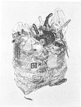
信國由佳理 《Proof of my life》 コラグラフ・銅版 83×63cm