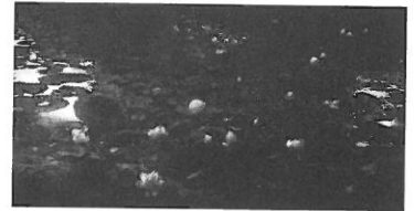
野嶋 草《After the beauty asleep 08》 銅版 50×95cm