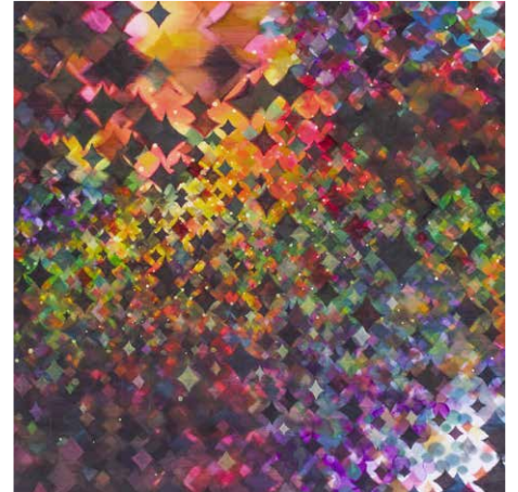
(4Seasons) 2015 ※Hilcrhyme(ヒルクライム)CDジャケット