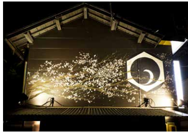
(情熱寿司ダイニング)壁画 2010