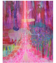
(ラブライトとソナライトのために) 2006