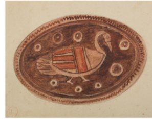
《農民美術デザイン画》1923(大正12)年頃