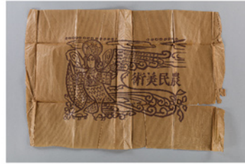
《農民美術包装紙》大正時代