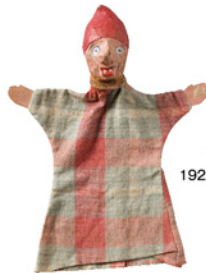
《ギニョール》 1924(大正13)年