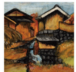
《第1回児童自由画展覧会入選作品》 1919(大正8)年