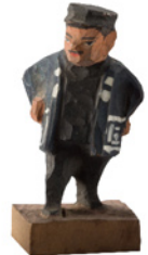
《木片(こっば)人形【人物】》 大正～昭和初期