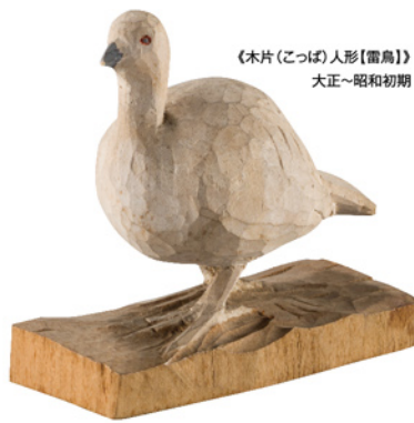
《木片(こっば)人形【雷鳥】》 大正～昭和初期

1919(大正8)年、版画家・洋画家として知られる山本鼎(1882-1946)が始めた「農民美術運動」と「児童自由画教育運動」。農民の手工芸品として始まった「農民美術」の生産は、大正から昭和初期にかけて一時全国に広がりました。現在は、長野県上田地域の伝統的工芸品として定着し、白馬・大町など県内各地にも影響を及ぼしました。一方、正確な模写を評価する大正期の学校教育を打破し、子どもたちの創造性に着目した「自由画」の理念も、今日の図工美術教育の基礎として受け継がれています。本展は、100年を迎えた両運動の果たした意義を見つめ直し、今後の可能性を探ります。