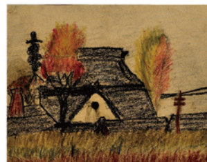
《第1回児童自由画展覧会入選作品》 1919(大正8)年