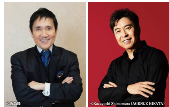
指揮 大植英次 ピアノ 小曾根真*

曲目 武満徹／弦楽のためのレクイエム ガーシュウィン／ラプソディ・イン・ブルー* ベートーヴェン／交響曲 第3番 変ホ長調 作品55「英雄」