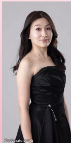
最優秀賞・聴衆賞