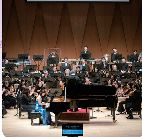
(2019年1月サントミュージゼ公演の様子)